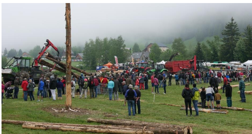
Démonstration « De l'arbre à la planche »

Au travers de multiples animations, l'évènement se veut vulgariser les pratiques des professionnels de la forêt et du bois afin d'augmenter le niveau de connaissance mutuel et atténuer les conflits d'usage entre utilisateurs de la forêt. La désormais habituelle démonstration commentée « De l'arbre à la planche », avec démonstrations de toutes les étapes du bûcheronnage au sciage de la grume a connu un franc succès et suscité de nombreuses questions de la part du public.